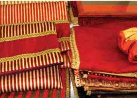
الأشغال الحرفية المصنعة يدوياً ARTIZANA