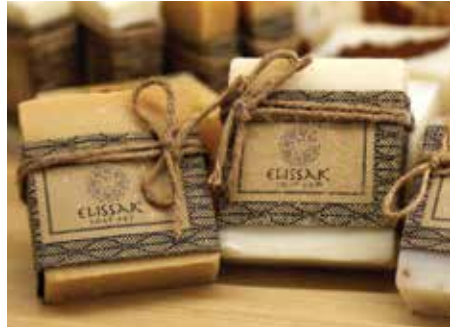
معمل الصابون العضوي ELISSAR