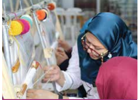
مشغل حياكة السجاد اليدوي ROZANA