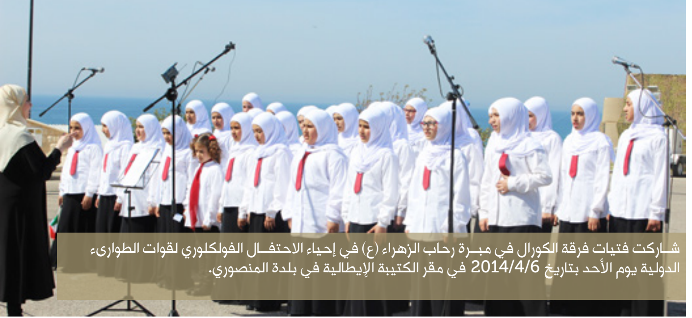
شاركت فتيات فرقة الكورال في مبرة رحاب الزهراء (ع) في إحياء الاحتفال الفولكلوري لقوات الطوارئ الدولية يوم الأحد بتاريخ 2014/4/6 في مقر الكتيبة الإيطالية في بلدة المنصوري.