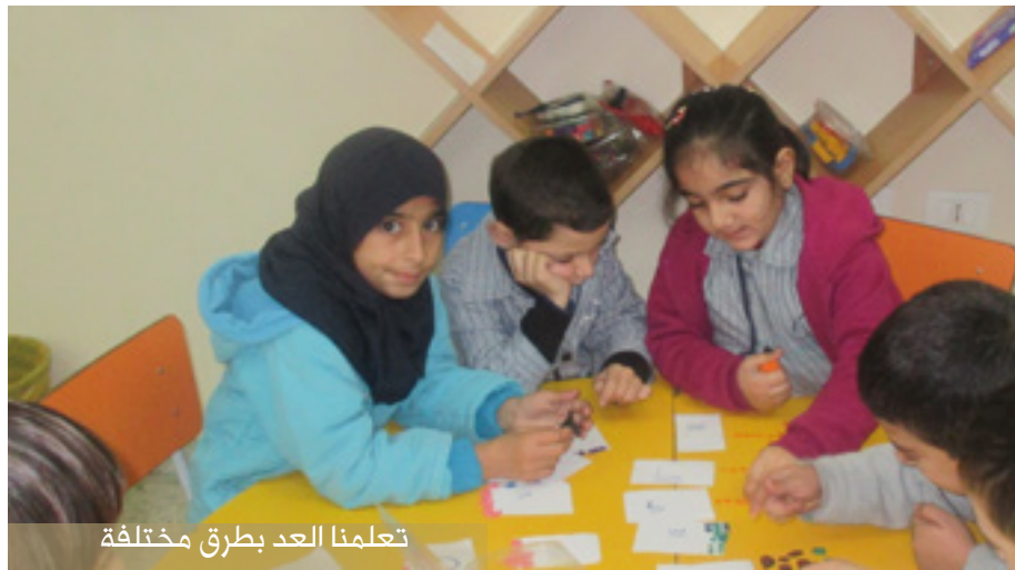
تعلمنا العد بطرق مختلفة