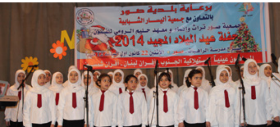
شاركت فرقة كورال مؤسسات الإمام الصدر 22/12/2014 باحتفال بمناسبة الميلاد المجيد ورأس السنة في مدرسة راهبات صور من تنظيم جمعية تراث صور ومعهد حلیم الرومي بالتعاون مع جمعية أليسار الشبابية.