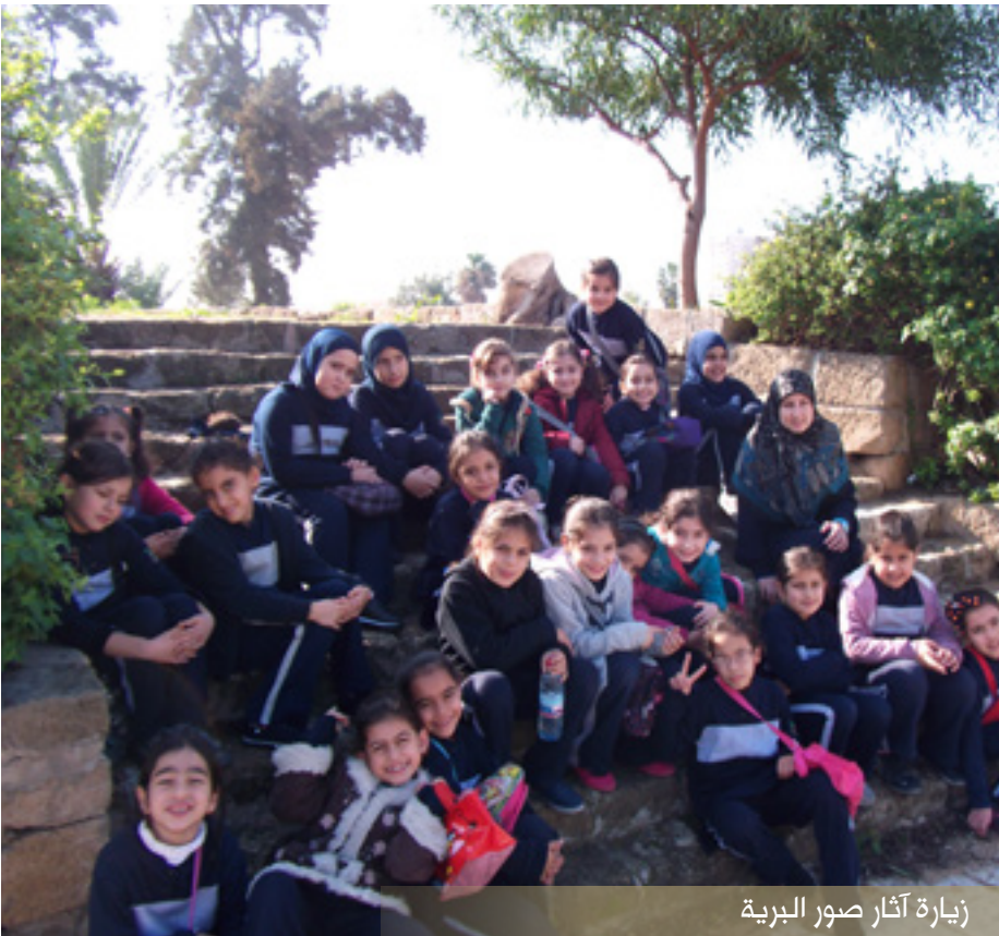
زيارة آثار البرية