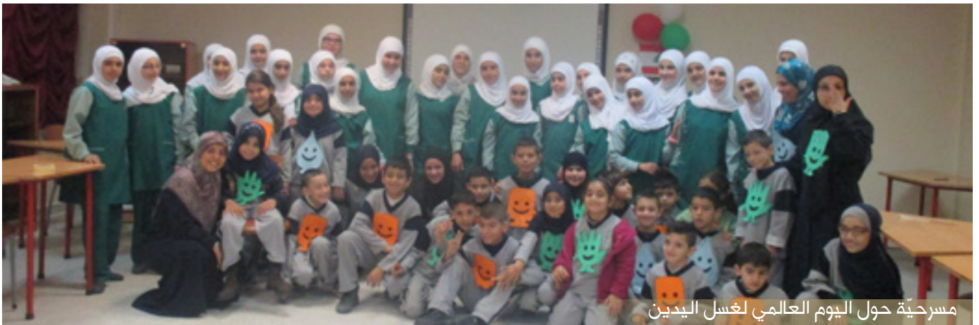
مسرحية حول اليوم العالمي لغسل اليدين