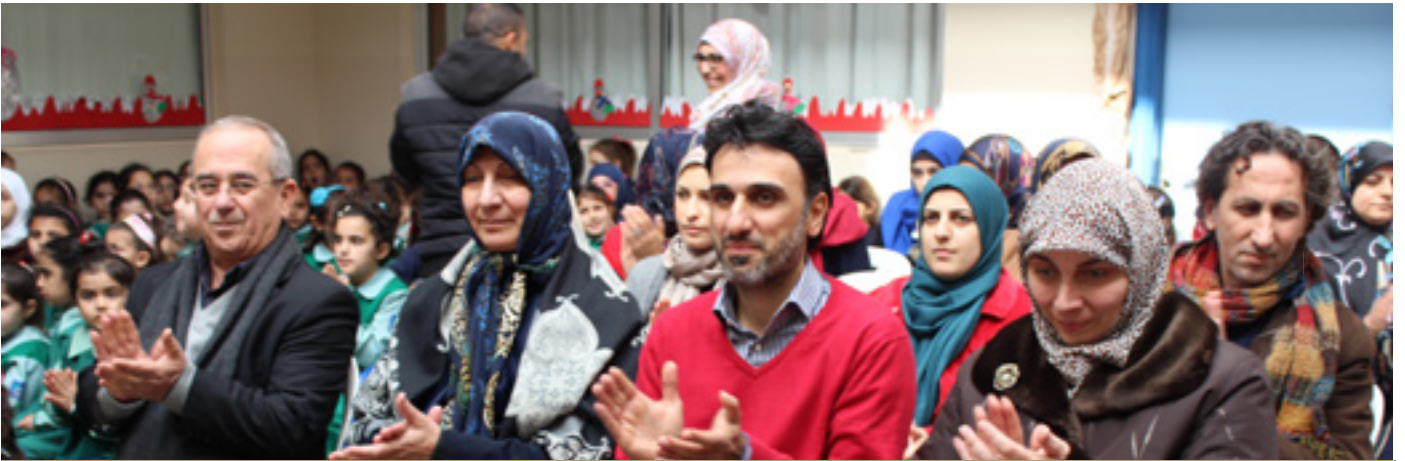
الميلاد مع أطفال التربية المختصة