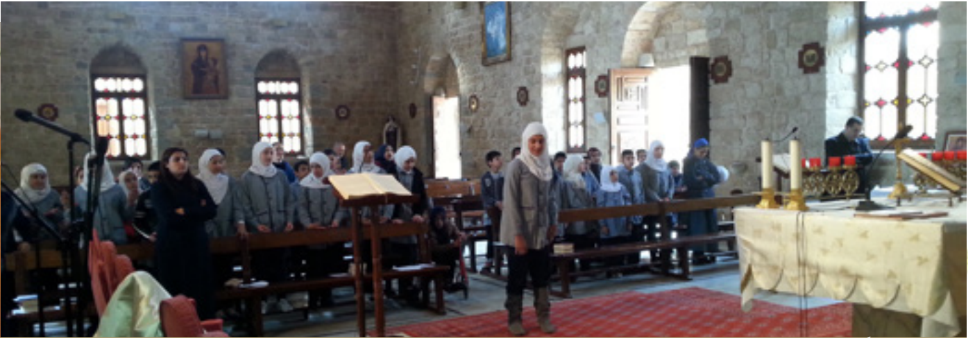
صليتنا معاً لأجل لبنان