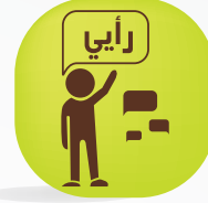
التعبير عن الرأي